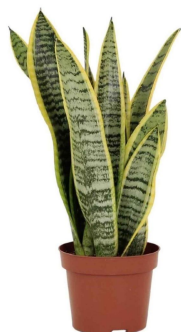
Espada de San Jorge