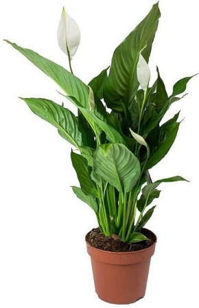
Lirio de la paz