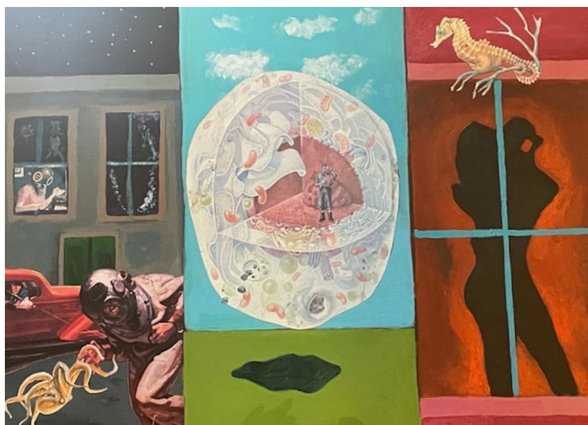
David Coulter, Calle Cervantes , 2002, collage and acrylic paint (collage y pintura acrílica), 37.2 cm x 50 cm.