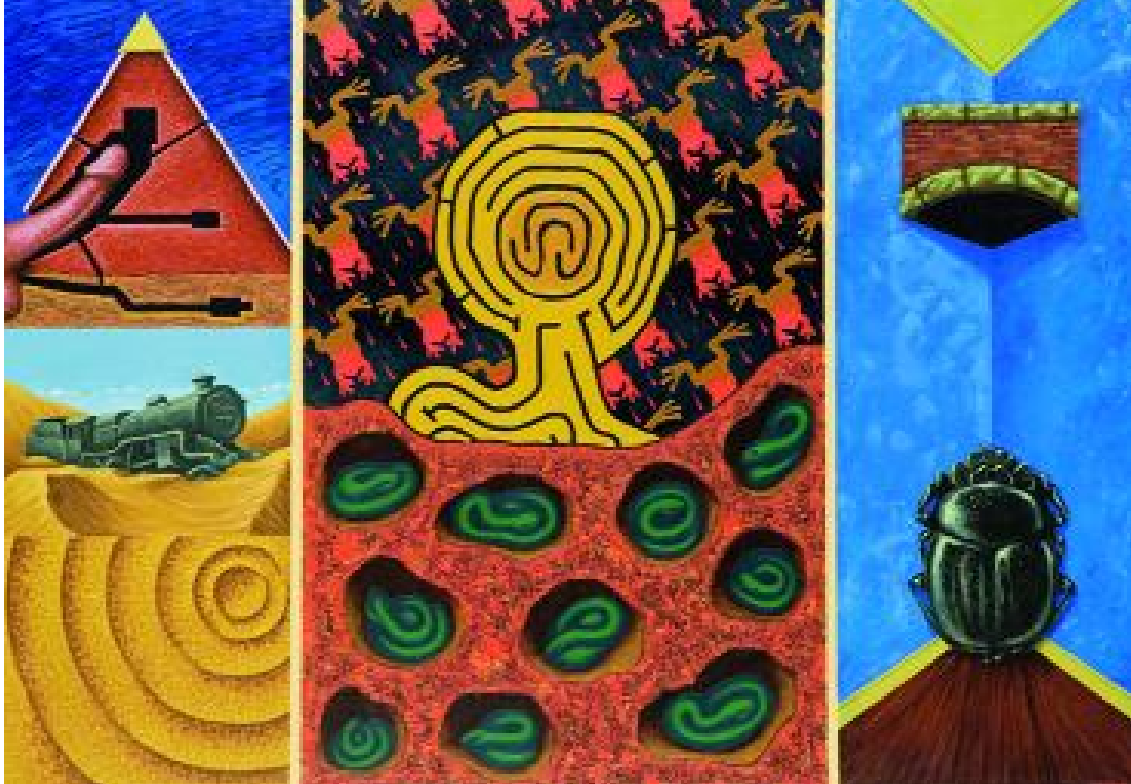
Philip West, El despertar , 1991. Óleo/lenzo, 81 x 115,7 cm. Colección Fundación Eugenio Granell

Pegadas e marcas supón un espazo onde divagar sobre a relación que o artista establece co medio a través de marcas que serven de guía nun mapa imaxinario.